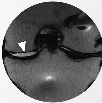
Knorpelimplantat, 6 Wochen p.o.