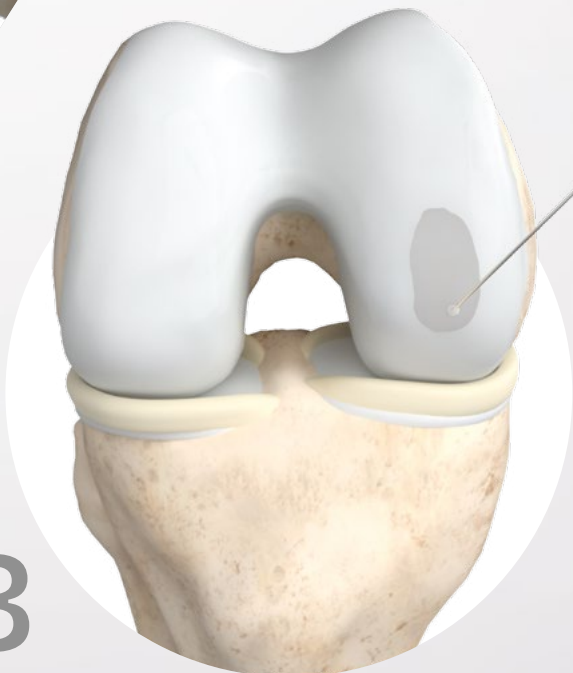
Defektfüllung mit 3D-Matrix