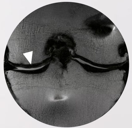
Knorpelregenerat, 6 Monate p.o.